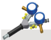
Täyttölaite Tupla (8Bar) 67193