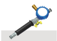
Täyttölaite Single (8Bar) 67192

CLT nostotyyntjä voidaan käyttää kaksi päällekkäin.