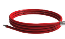
Täyttöletku 5m sis. 1/4" nipat 67180