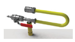
Sulkuletku 1/4" 67765

RemaTipTop Oy Hakamäenkuja 7 01510 VANTAA